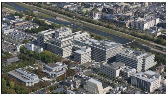
京都府立医科大学および附属病院

一人の専攻医を常に複数の指導医が指導・評価を行うことにより、専攻医の技能習得状況を正確に把握しながら、十分な症例数を偏りのない内容で提供することが可能であり、各専攻医を信頼に足る病理専門医に確実に育てることを目指している。