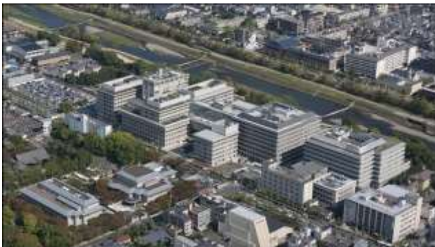
京都府立医科大学および附属病院

一人の専攻医を常に複数の指導医が指導・評価を行うことにより、専攻医の技能習得状況を正確に把握しながら、十分な症例数を偏りのない内容で提供することが可能であり、各専攻医を信頼に足る病理専門医に確実に育てることを目指している。