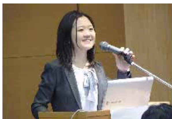
きめ細やかな学会発表指導