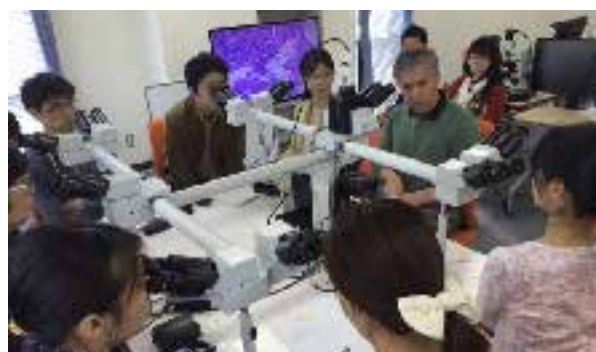
国際的なエキスパートによる特別セミナー