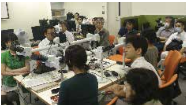
合同症例検討会（くすのき会）