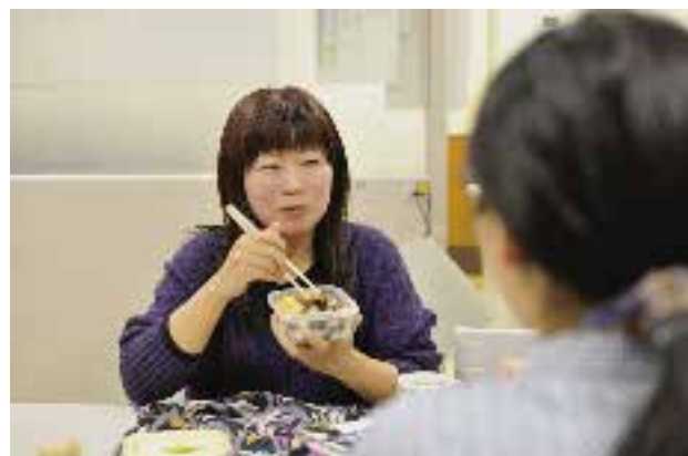
楽しく適切なライフワークバランスで