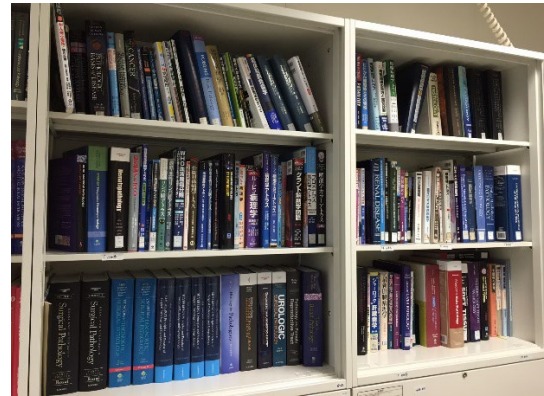
図 2. 教育図書。病理診断学に関連する国内外の教科書は総論・各論を含めて最新のものを揃えており、改訂がなされた書籍は随時更新しています。