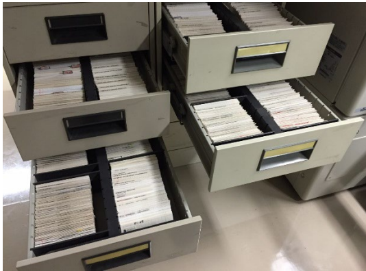
図 1. 教育用標本ファイル。ガラス標本が各臓器別、疾患カテゴリー別に整理されているので、日常的に遭遇するものから稀なものまで、数多くの疾患について学ぶことができます。

文献の紹介などが掲載されており（図 3）、今後はバーチャルスライドで構成されるアーカイブも専攻医・指導医を対象として公開していく予定です（図 4）。