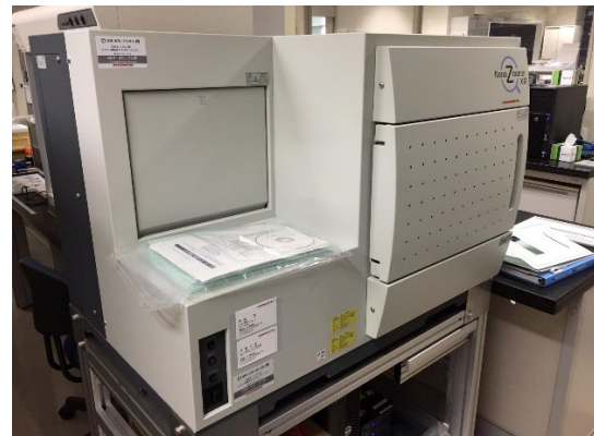
図 4. バーチャルスライドシステム。2015 年より本格稼働しています。